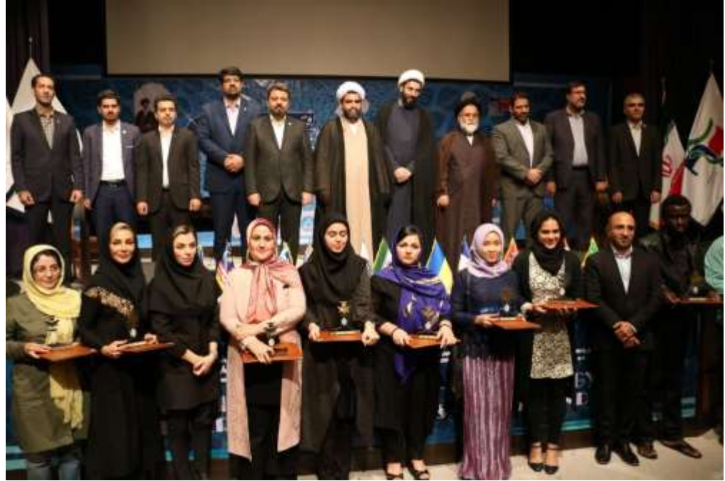
جشن روز دانشجو با حضور رئیس محترم نهاد رهبری کشور و مدیران سازمان منطقه آزاد و پردیس های دانشگاهی کیش